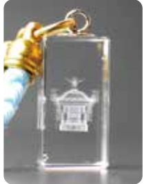
5 W10mm × D10mm × H20mm