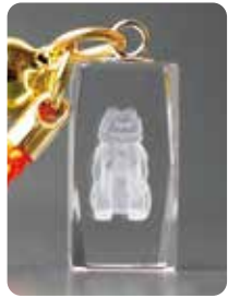
1 W10mm × D10mm × H20mm