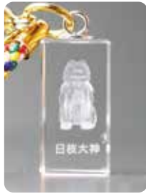
2 W10mm × D10mm × H20mm