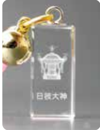
6 W10mm × D10mm × H20mm