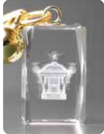
7 W12mm × D12mm × H20mm