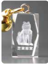
4 W12mm × D12mm × H20mm