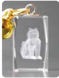
3 W12mm × D12mm × H20mm