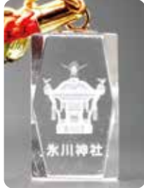
8 W12mm × D12mm × H20mm